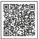
防犯ガラスの効果

強靱な中間膜(特殊フィルム)が内部に密着されているため、通常のガラスに比べ破壊されにくくなっています。