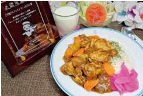
よこすか海軍カレー 2,280円(税込) 辛さ:★★