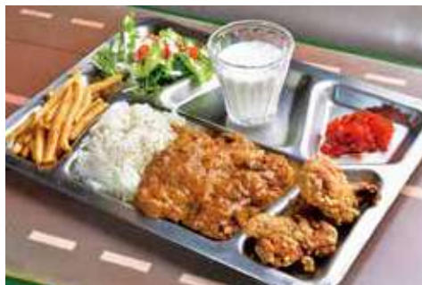
よこすか海軍カレー 1,500円(税込)