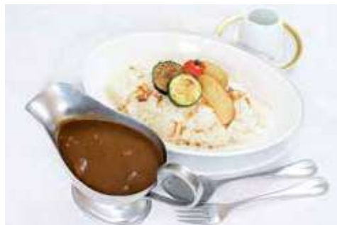
国会ビーフカレー(アホエンオイル付き) 2,200円(税込)