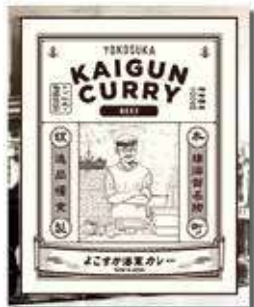
よこすか海軍カレー KAIGUN CURRY 660円(税込) 辛さ：★★★★