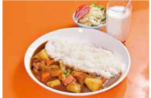
よこすか海軍カレー 1,290円(税込) 辛さ:★★