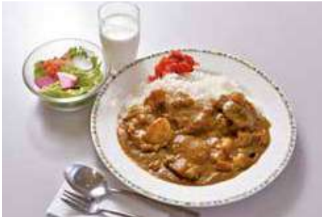
よこすか海軍カレー 1,050円 辛さ:★★