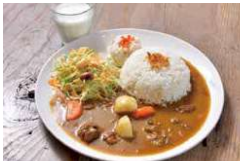
よこすか海軍カレー 1,600円(税込) 辛さ:★★