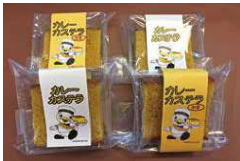
カレーカステラ 194円(税込)