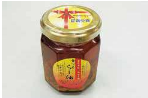
食べるカレーラー油 594円(税込)