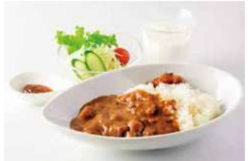
よこすか海軍カレー 1,300円(税込) 辛さ: ★★★