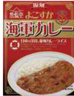
復刻よこすか海軍カレー 410円(税込) 辛さ:★★★