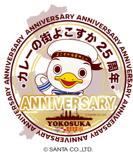
カレーの街よこすか 25周年ロゴ