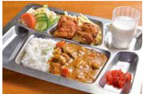
よこすか海軍カレー 1,530円(税込) 辛さ:★★★★