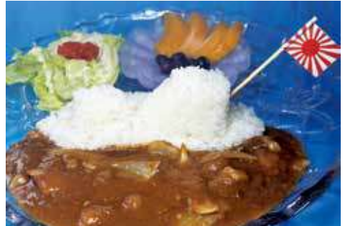
よこすか海軍カレー 900円(税込) 辛さ:★★★