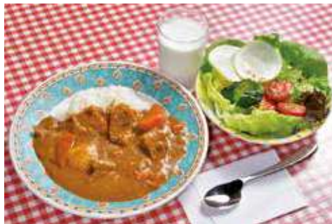
よこすか海軍カレー サラダ・牛乳つきセット 1,580円 (税込) 辛さ: ★★