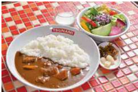
よこすか海軍カレー 1,830円(税込) 辛さ: ★★★