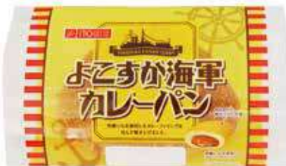
よこすか海軍カレーパン 辛さ：★