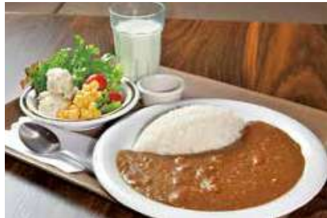
よこすか海軍カレー 1,650円(税込) 辛さ:★★