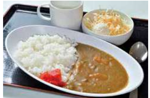
よこすか海軍カレー 1,130円 辛さ:★★