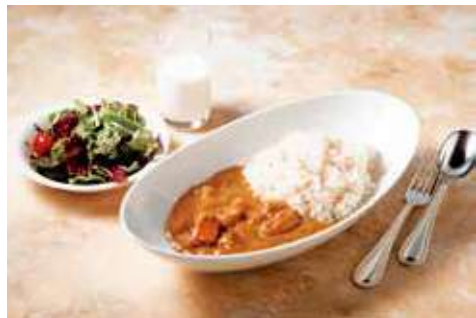
よこすか海軍カレー 2,500円(税込) 辛さ: ★