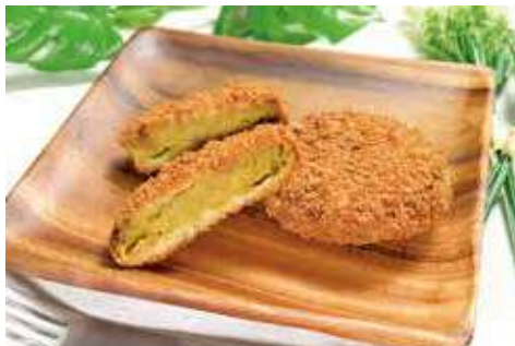
よこすか海軍カレーコロッケ 180円(税込)