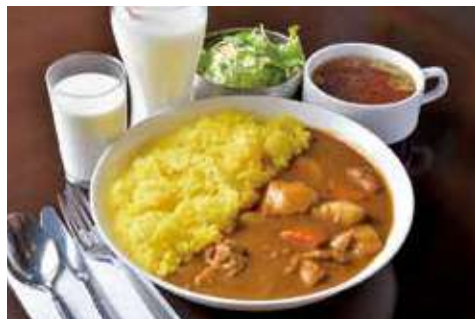
よこすか海軍カレー 1,298円(税込) 辛さ:★★