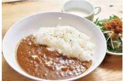
よこすか海軍カレー 1,100円(税込) 辛さ:★★