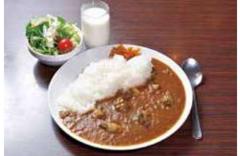
よこすか海軍カレー 1,408円(税込) 辛さ: ★★★