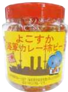
よこすか海軍カレー柿ピー オープン価格