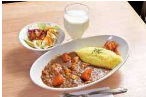
よこすか海軍カレー 1,580円(税込) 辛さ: ★★★