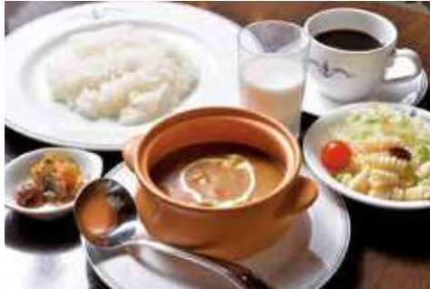
よこすか海軍カレー 1,650円(税込) 辛さ:★★