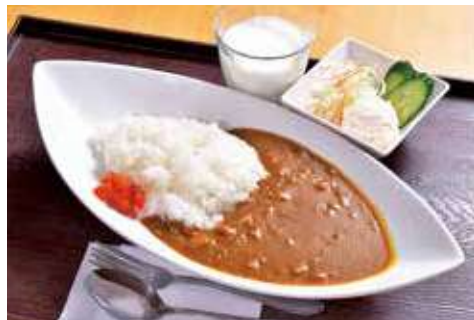
よこすか海軍カレー 1,700円(税込) 辛さ:★★★