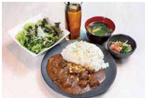
牛タンカレー 980円(税込) ※平日ランチのみ