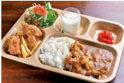
よこすか海軍カレー 1,500円(税込) 辛さ:★★