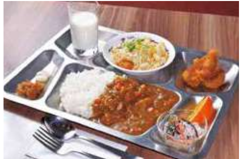
ビュッフェスタイル 辛さ:★★★