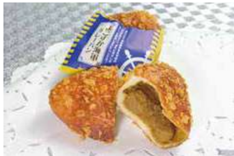
よこすか海軍カレーパン 216円(税込)