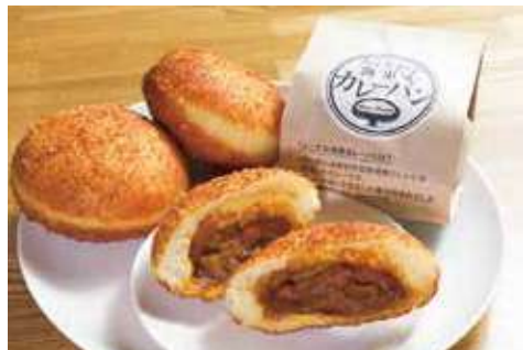
よこすか海軍カレーパン 260円(税込)