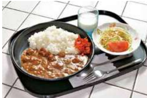
よこすか海軍カレー 860円 (税込) 辛さ: ★★★★★