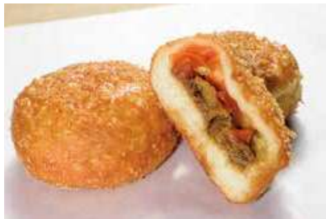
よこすか海軍カレーパン 237円(税込)