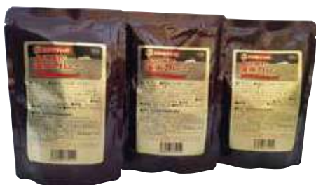
お肉屋さんのおよすか海軍カレー 1袋 490円(税込) 辛さ：甘口・中辛・辛口