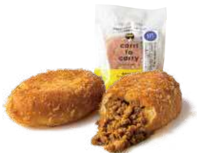
カリットカレーよこすか海軍カレー 432円(税込)