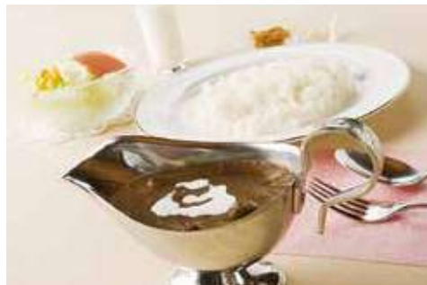
海軍カレーセット 1,300円(税込)