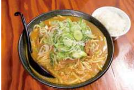
よこすか海軍カレーラーメン 930円(税込)