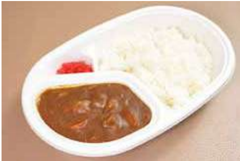
ビーフカレーライス 600円(税込)