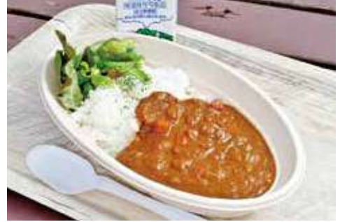
よこすか海軍カレー 1200円 辛さ:★