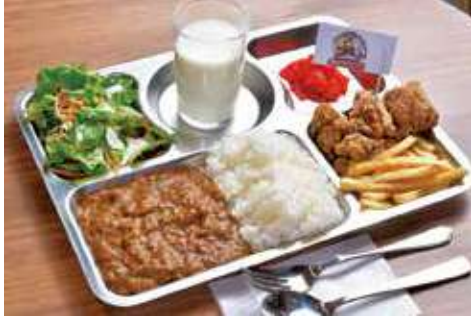
よこすか海軍カレー 1,900円(税込) 辛さ: ★★★