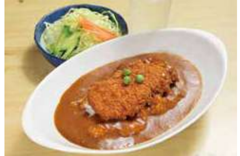
揚げたてカツカレー 1,500円(税込)(ディナーは1,850円(税込))