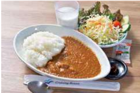
よこすか海軍カレー 1,200円(税込) 辛さ: ★★★