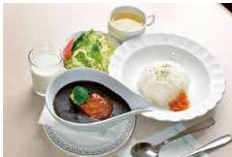
よこすか海軍カレー 1,200円(税込) 辛さ:★★★★