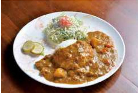
よこすか海軍カレー 1,580円(税込) 辛さ:★★★