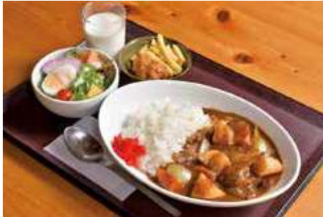
よこすか海軍カレー 1,500円(税込) 辛さ:★★★