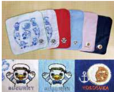
今治生地のハンカチ「海軍カレー」「スカレー」 770~880円(税込)