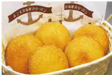
よこすか海軍カレーパン オープン価格