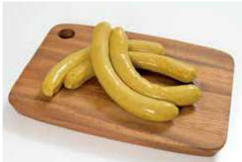
よこすか海軍カレーソーセージ 100g 520円(税込)