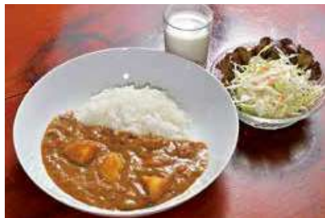
よこすか海軍カレー 1,600円(税込)