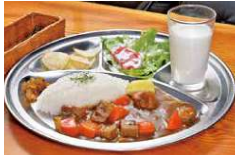
よこすか海軍カレー 1,860円(税込) 辛さ:★★