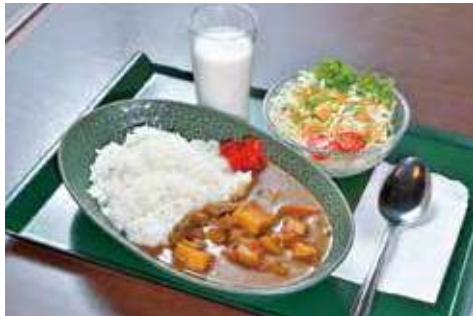
よこすか海軍カレー 1,380円(税込) 辛さ: ★★★