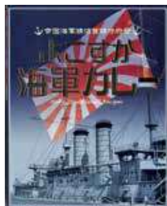
横須賀海軍カレー本舗よこすか海軍カレー 580円(税込) 辛さ：★★★