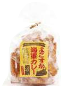
よこすか海軍カレーせんべい 540円(税込) 辛さ：★★★

コーラル、New DAYS横須賀駅店、 横須賀海軍カレー本舗、 横須賀PA上り店、 イオンくま浜店で販売中！