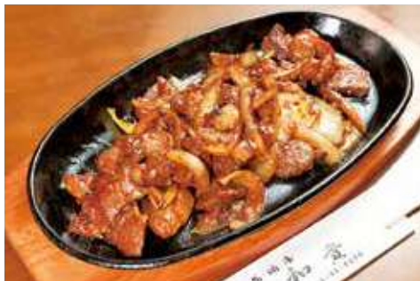
横須賀牛ホルモンカレー味 830円(税込)