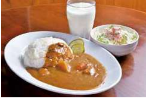
よこすか海軍カレー 1,580円 辛さ:★★