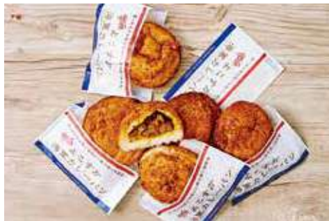
よこすか海軍カレーパン 320円(税込)