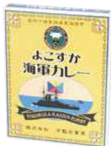
よこすか海軍カレー 486円(税込) 辛さ：★★★