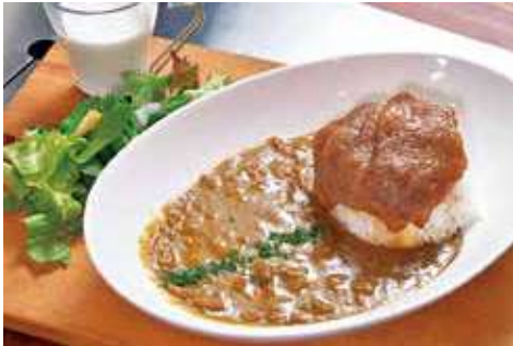
よこすか海軍カレー 1,650円(税込) 辛さ:★