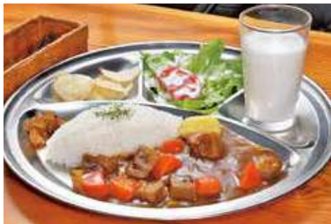
よこすか海軍カレー 1,860円(税込) 辛さ:★★