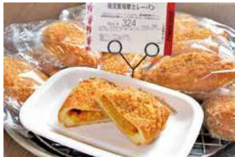
よこすか海軍カレーパン 324円(税込)