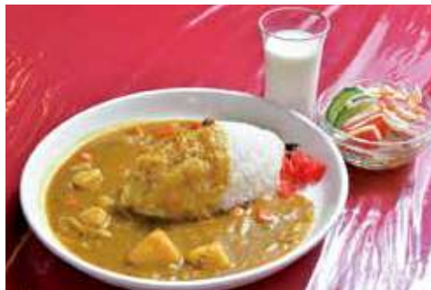
よこすか海軍カレー 1,300円(税込)