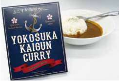
よこすか海軍カレー 540円(税込) 辛さ:★★