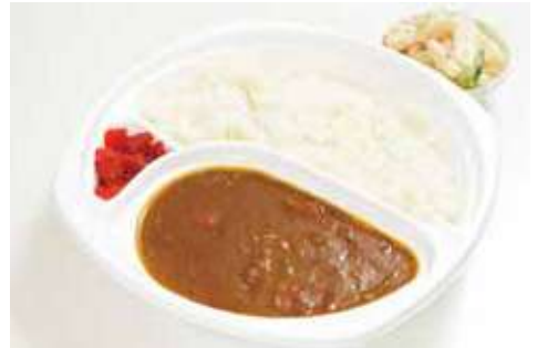
よこすか海軍カレー 650円(税込)