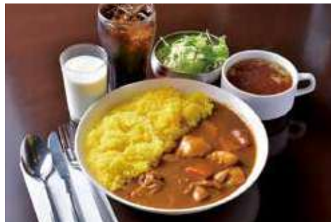
よこすか海軍カレー 1,298円(税込)