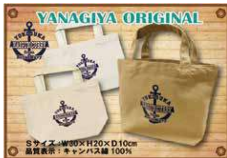
Sサイズ:W30×H20×D10cm 品質表示:キャンバス綿 100%