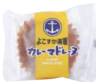
よこすか海軍カレーマドレーヌ