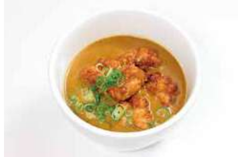
唐揚げ(3個)カレーうどん 1,200円(税込) (唐揚げ2個は1,100円)