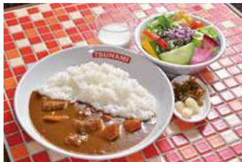
よこすか海軍カレー 1,830円(税込) 辛さ:★★★★