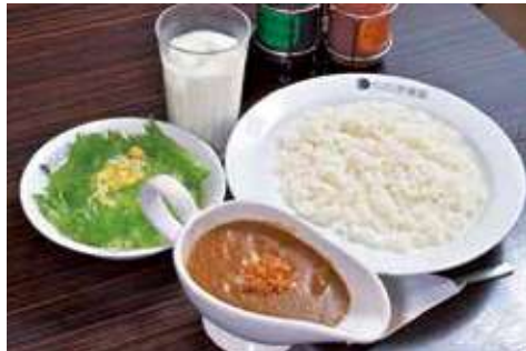
よこすか海軍カレーセット 1,520円 (税込) 辛さ: ★★