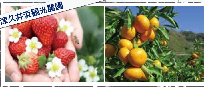
津久井浜観光農園