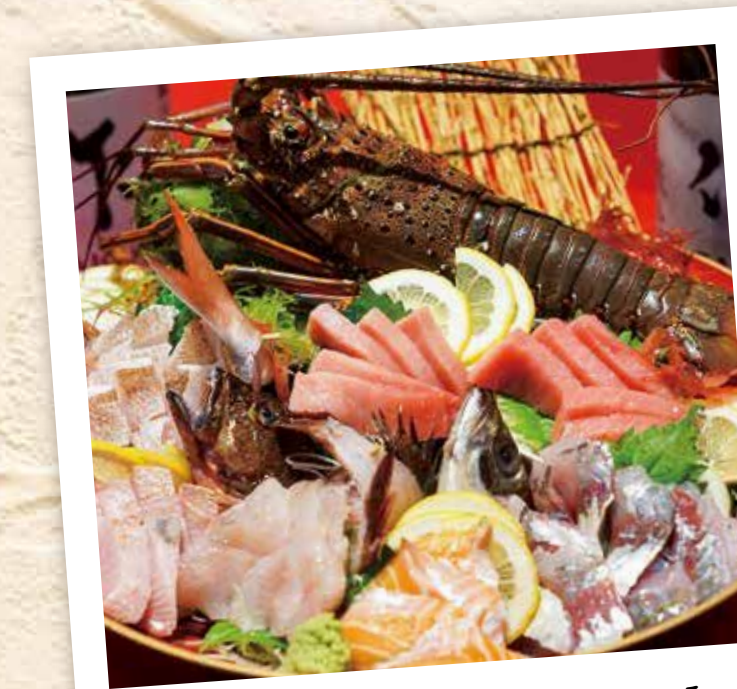
とれたて新鮮、地場のごちそう