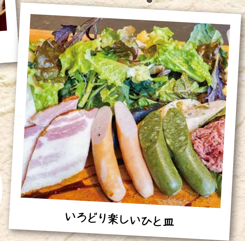
いろいろ楽しいひと皿