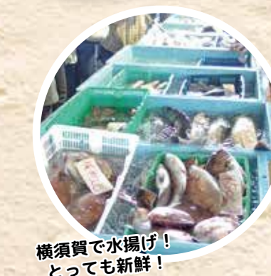
横須賀で水揚げ！ とっても新鮮！