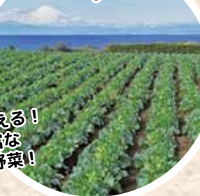
季節で味わえる！ 種類豊富な よこすか野菜！